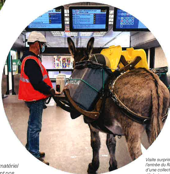
Visite surprise à l'entrée du RER lors d'une collecte de déchets, partenariat Véolia