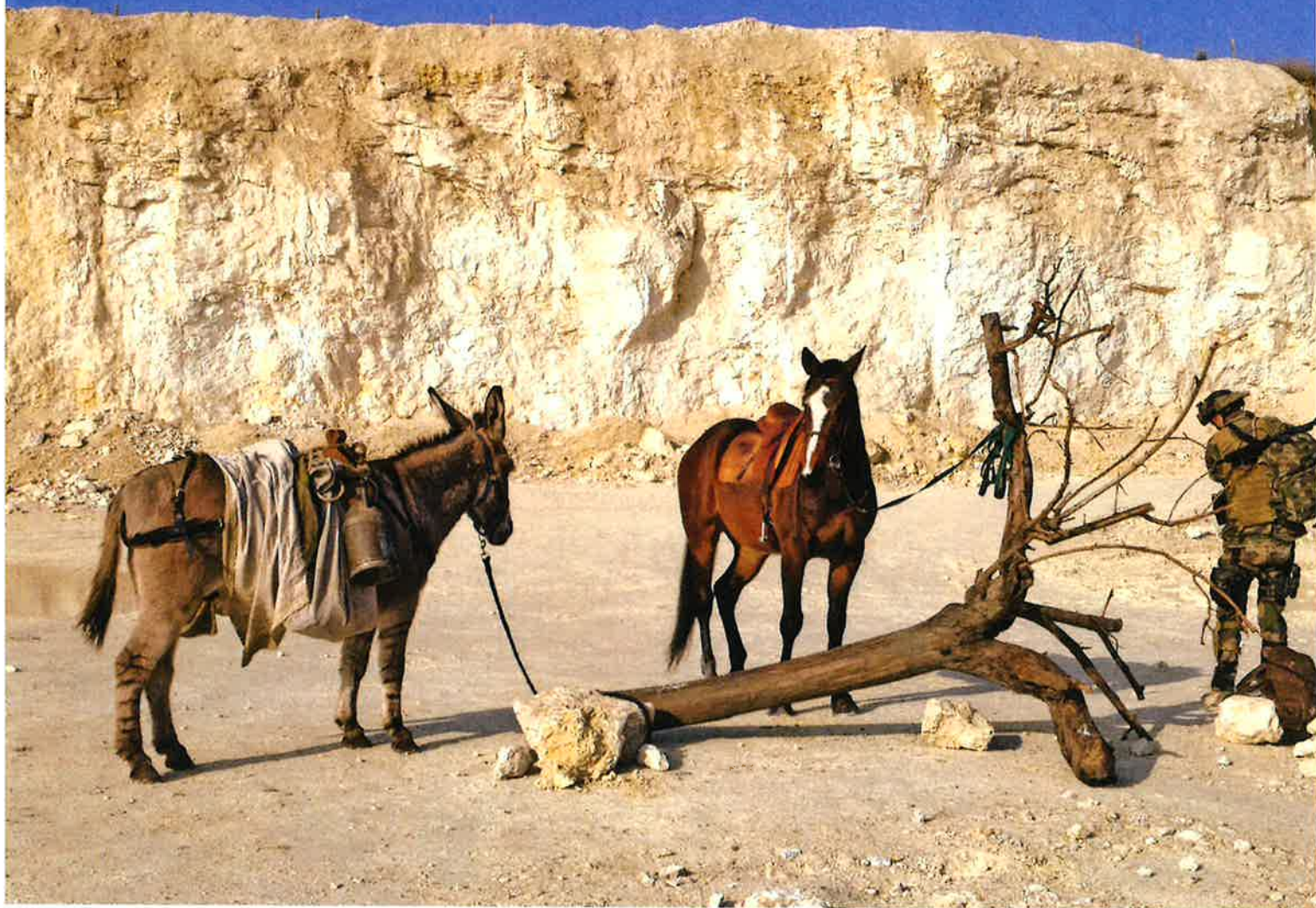
Portage et participation au tournage du film « Un militaire en Afghanistan »