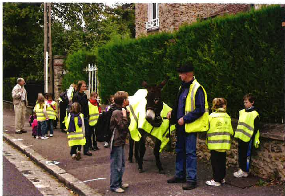
Transport de cartables par l'âne mascotte sur le trajet « 1000 pattes de Bois-le-Roi »

Chemin de Samoïs 77590 Bois-le-Roi Tél : 06 03 32 38 66 Site : https://anerie-bacotte.fr