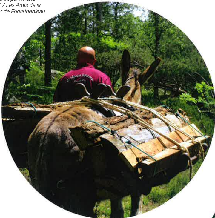
Portage de bois pour fabriquer des marches en forêt, partenariat ONF / Les Amis de la Forêt de Fontainebleau